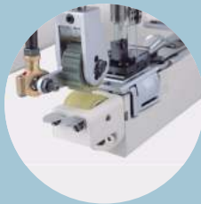
Sistema de rodillo trasero (puller)