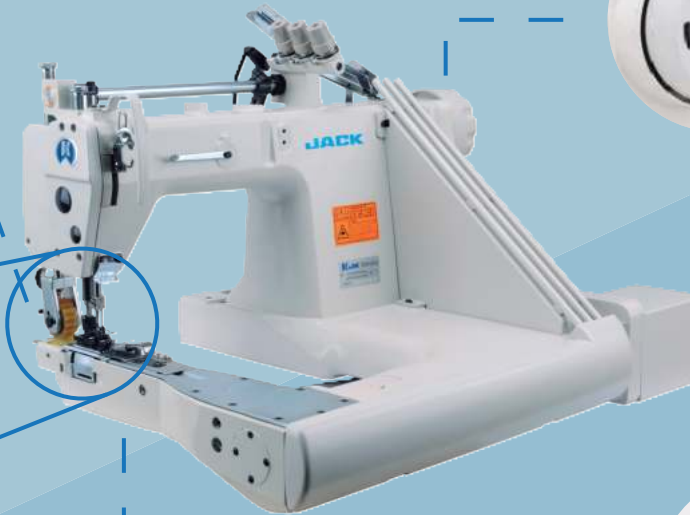
Estructura cilíndrica del brazo

Tipo de costura: Amplia gama de aplicaciones