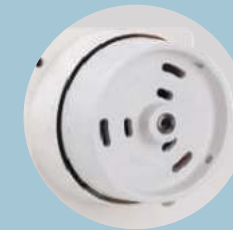
Motor integrado 220V