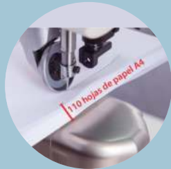
Pie con rodaja