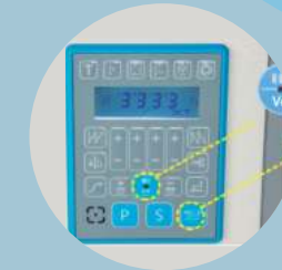
Panel de operación incorporado